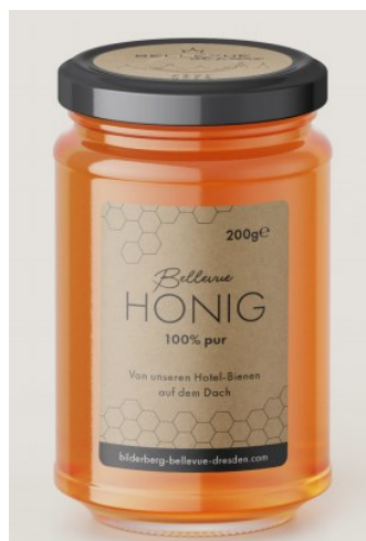
Bild 2: Seit März 2018 leben auf dem Hotel-Dach insgesamt 150.000 fleißige Bellevue Bienen. Pro Jahr und Bienenvolk entstehen hier zwischen 25 und 50 Kilogramm Honig, die postwendend auf dem Buffet des Frühstücksbuffets für die Gäste landen oder abgefüllt zum Verkauf im Market Place angeboten werden.