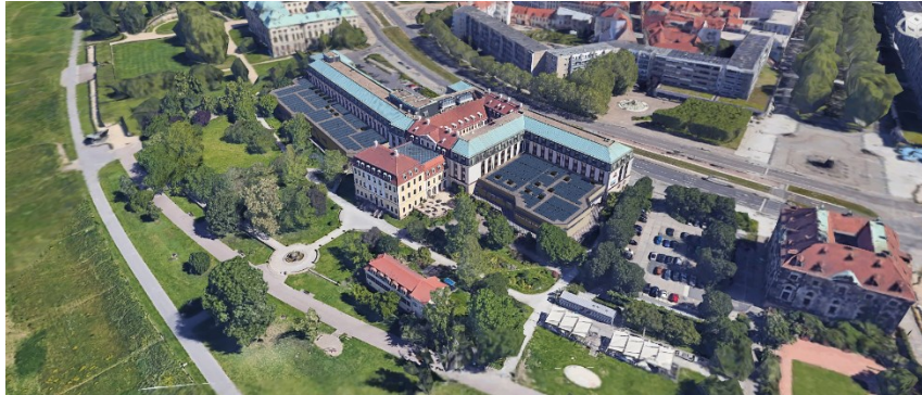
Bild 5: In einem Hotel der Größe des Bellevue ist der Verbrauch und Bedarf nach energiesparenden Maßnahmen immens und schon seit Jahren fester Bestandteil im Tagesgeschäft. Die Installation der Photovoltaikanlage im Frühjahr 2023 gehört daher zu den wohl bedeutendsten und klügsten Investitionen des größten Innenstadthotels in Dresden.