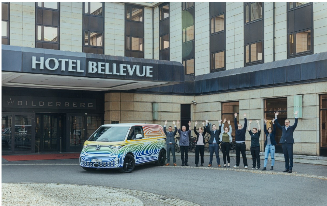
Bild 4: Das Bellevue Team im Rahmen der Weltpremiere des ID.Buzz im März 2022. Elektromobilität ist ein Teil vom Ganzen und gehört als eine der Facetten von Nachhaltigkeit schon lange zu den globalen Megatrends. Das Vorhandensein einer E-Ladesäule rückt auf der Bedürfnispyramide der Gäste immer weiter nach oben. Gemeinsam mit städtischen Partnern wie der Gläsernen Manufaktur von Volkswagen, dem Amt für Wirtschaftsförderung der Landeshauptstadt Dresden sowie der Dresden Marketing GmbH engagiert sich das Hotel als Botschafter für E-Mobilität.