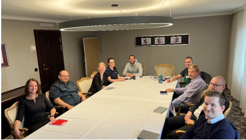
Bild 3: Nachhaltigkeit betrifft ausnahmslos jede Abteilung und jeden Bereich im Hotel. Deshalb arbeitet ein ganzes Green Team an der Nachhaltigkeits-Mission. Mindestens ein Mitarbeiter pro Abteilung kommt zu den einmal im Quartal stattfindenden Green Meetings. Alle mit ihrem ganz eigenen Blickwinkel auf den Hotelalltag sitzen an einem Tisch, diskutieren Maßnahmen und legen Ziele für das nächste Meeting fest.